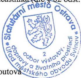
RNDr. Yvona Heroutová

Odvolání se podává s potřebným počtem stejnopisů tak, aby jeden stejnopis zůstal správnímu orgánu a aby každý účastník dostal jeden stejnopis. Nepodá-li účastník potřebný počet stejnopisů, vyhotoví je správní orgán na náklady účastníka (dle § 82 odst. 2 správního řádu).