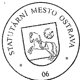
Ing. Miroslav Kauer vedoucí OTÚ oblasti Východ o.z. Ostrava

STRABAG STRABAG a.s. ODŠTĚPNÝ ZÁVOD OSTRAVA POLANECKÁ 827 721 08 OSTRAVA - SVINOV (14)