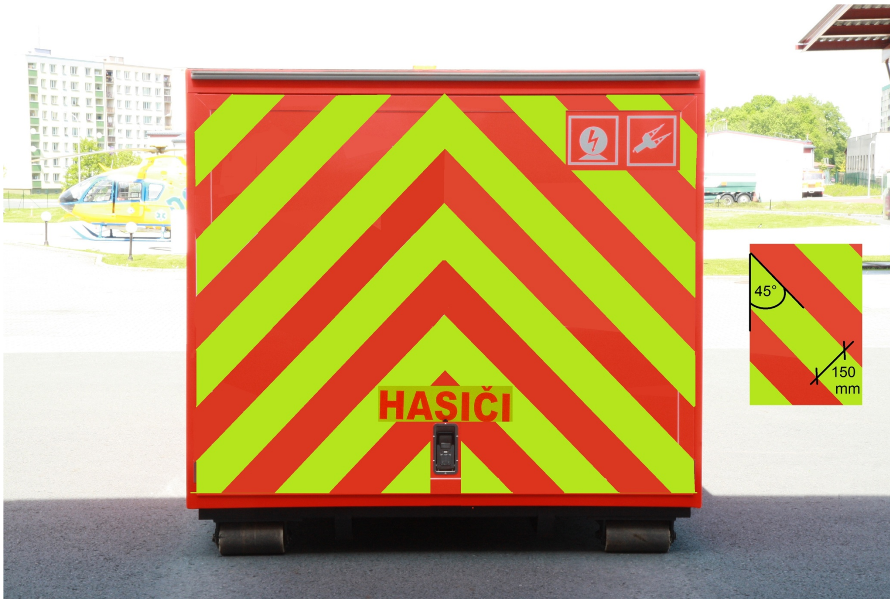
Veřejná zakázka ev. č. 5/2016/SMO Rekonstrukce technického kontejneru