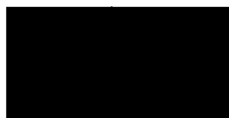
Mgr. Radim Babinec náměstek primátora